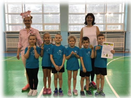
(14 «Фанфары награждения») проводится награждение команд

Ведущий: Снежную историю шепчут холода И сияют инеем прошлые года. Только наступающий - светит ярче всех: Скрыты в нем придания будущих потех. Он нам всем поведает сказку в год длинной И победы яркие принесет с собой. Чувства настоящие посеет в нем Январь, Наполняя радостью жизни календарь. Ребята и уважаемые взрослые! Поздравляем вас с наступающим 2020 годом! Пусть сбудутся ваши самые заветные мечты. А на память, чтобы вам запомнилась встреча, предлагаем сделать общую фотографию на память!