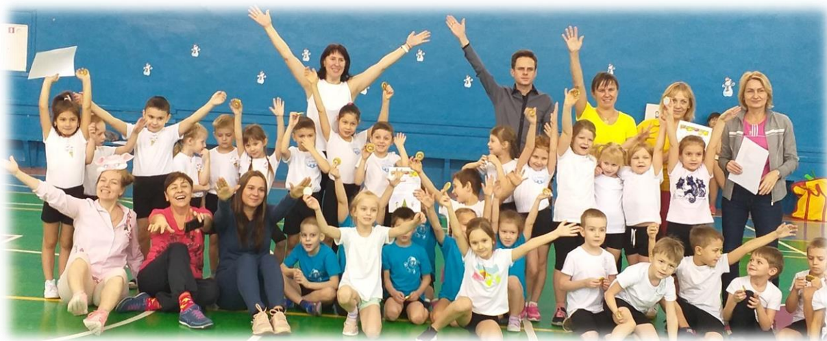
(15 «Снова за окном зима») команды фотографируются и уходят из зала

Ведущий: Снежную историю шепчут холода И сияют инеем прошлые года. Только наступающий - светит ярче всех: Скрыты в нем придания будущих потех. Он нам всем поведает сказку в год длинной И победы яркие принесет с собой. Чувства настоящие посеет в нем Январь, Наполняя радостью жизни календарь. Ребята и уважаемые взрослые! Поздравляем вас с наступающим 2020 годом! Пусть сбудутся ваши самые заветные мечты. А на память, чтобы вам запомнилась встреча, предлагаем сделать общую фотографию на память!